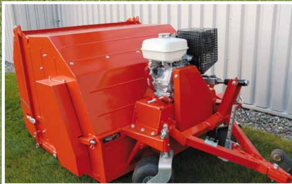
Ausführung TERRA CLEAN M mit Honda-Benzinmotor